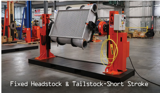
Fixed Headstock & Tailstock-Short Stroke