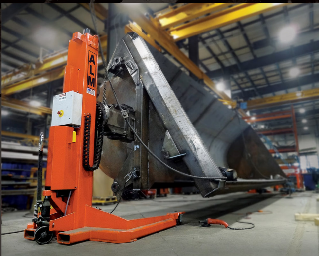
Fixed Headstock & Mobile Tailstock

En ALM Positioners, comenzamos contigo. Nuestros posicionadores líderes en la industria están diseñados con el objetivo de aumentar la productividad, los beneficios, la seguridad y la ergonomía de sus operaciones. Nuestra promesa es ofrecer posicionadores inteligentes basados en soluciones y una experiencia de servicio al cliente insuperable. Y trabajaremos incansablemente para asegurarnos de que esa promesa se cumpla.