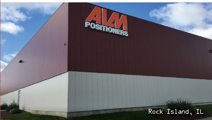
Rock Island, IL