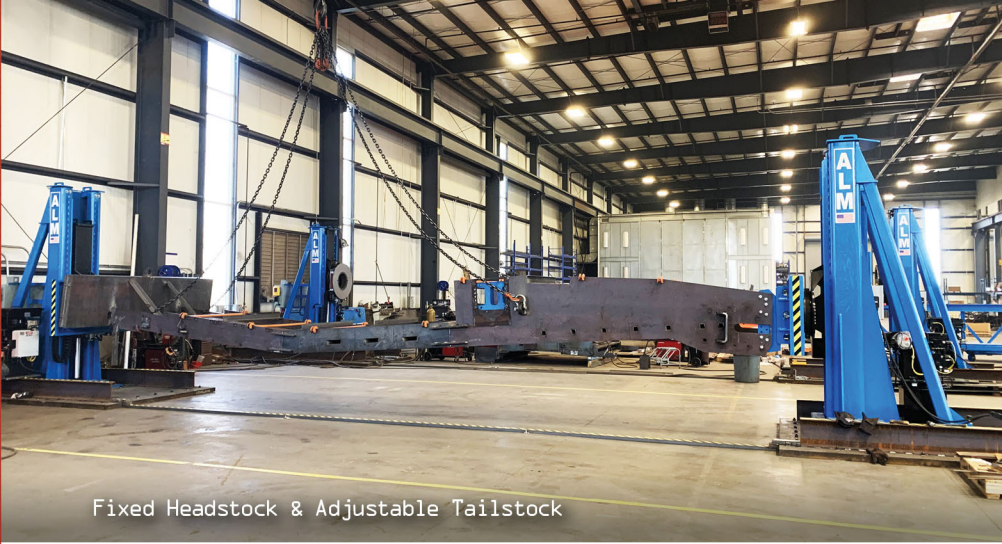
Fixed Headstock & Adjustable Tailstock